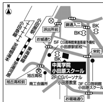
小田原スクール会場