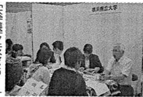
「大学進学フェスタ2011」での進学相談の様子

大学選びの第一歩は、自分の将来像を真剣に描いてみる事です。「将来の夢は○○だから、大学ではこんな学問を勉強する」とい